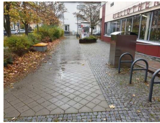
Weg vor dem Eingang