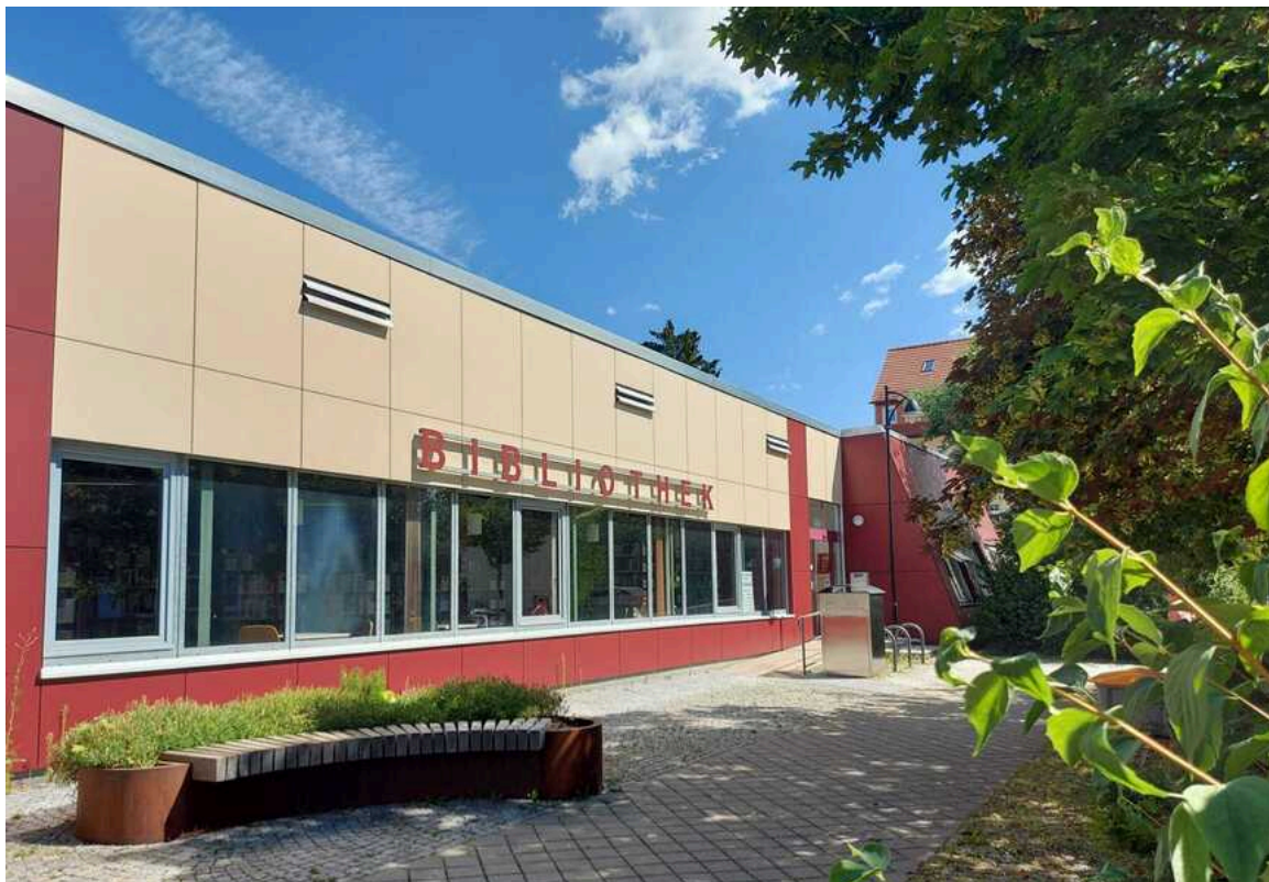
Bibliothek Ilmenau