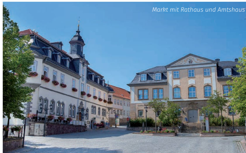
Markt mit Rathaus und Amtshaus