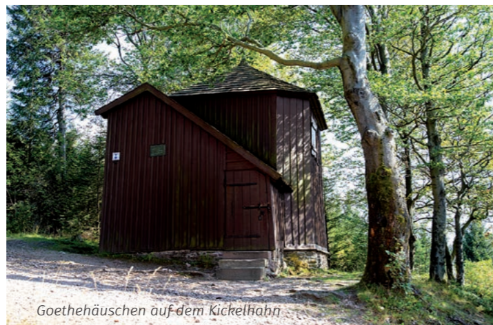
Goethehäuschen auf dem Kickelhahn