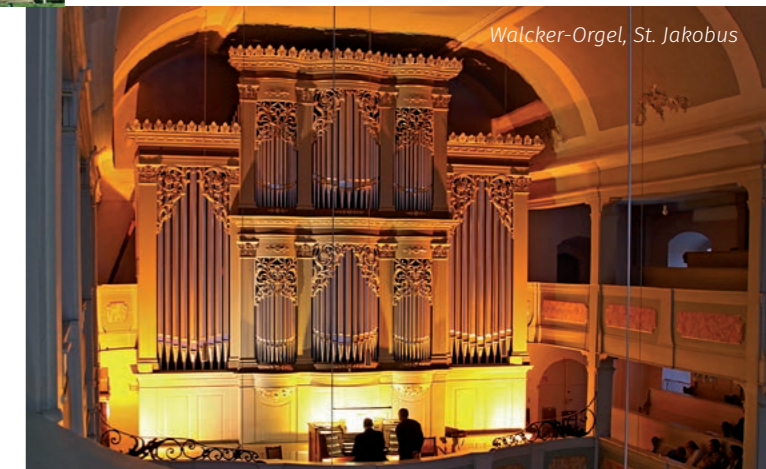
Walcker-Orgel, St. Jakobus