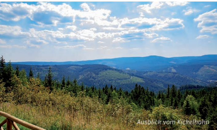
Ausblick vom Kickelhahn