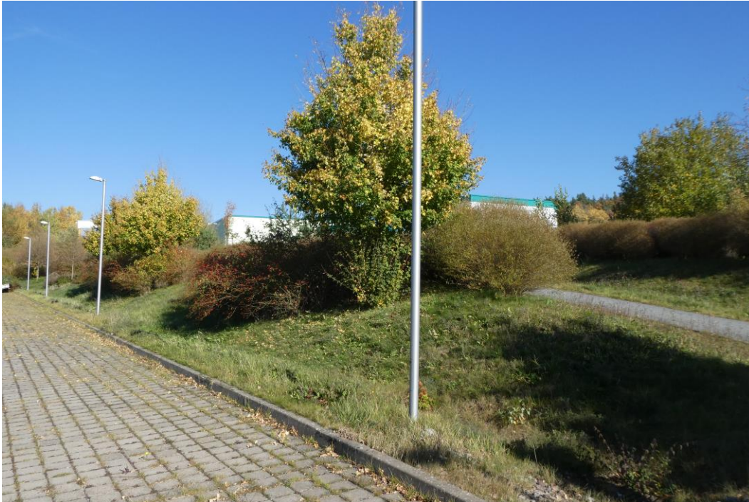
Abb. 3: Blick auf den nordöstlichen Teil des Planungsraumes mit Rad-/Fußweg sowie der Bepflanzung (17. Oktober 2017)