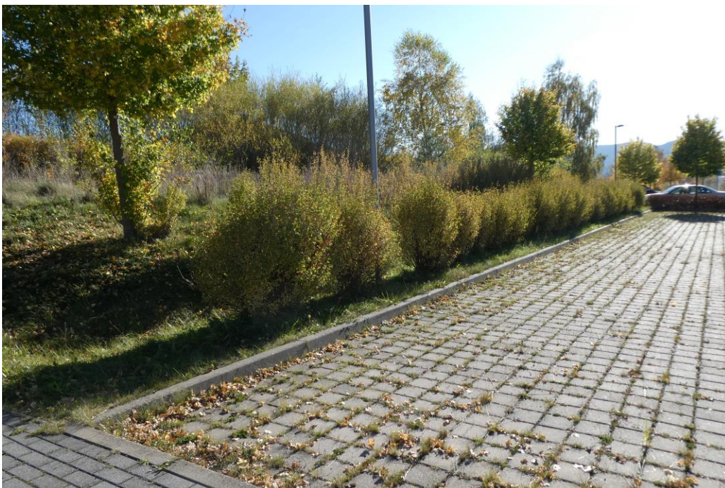
Abb. 4: Südwestlicher Teil des Planungsraumes; die angrenzenden Parkplatzflächen liegen außerhalb des Planungsraumes (17. Oktober 2017)