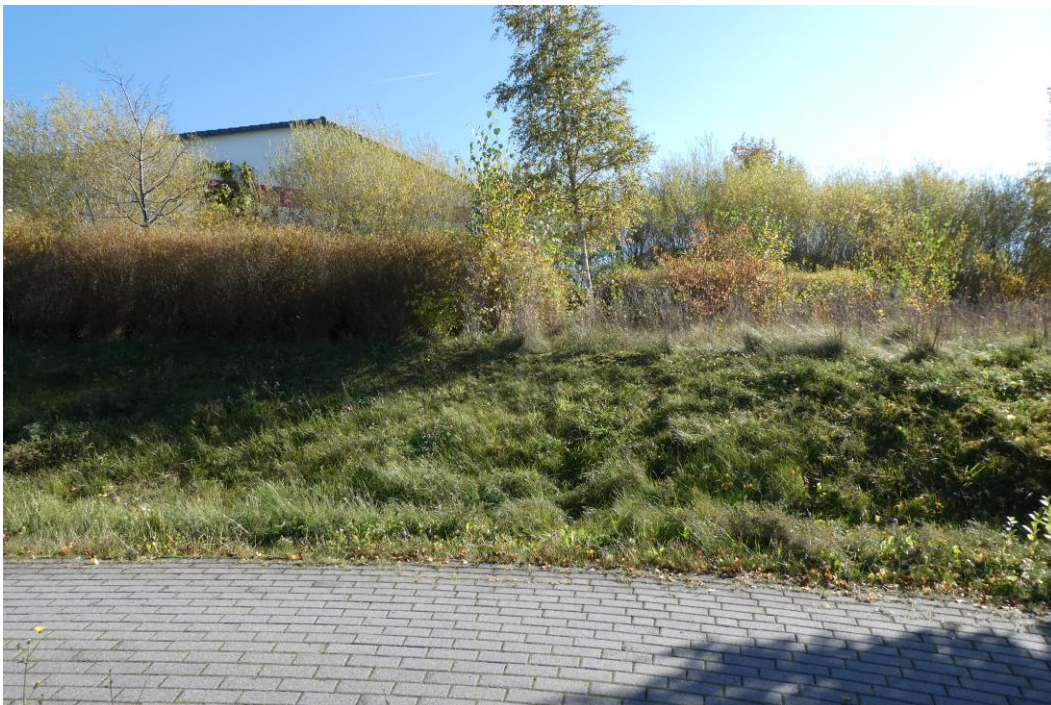
Abb. 2: Der Planungsraum aus nördlicher Richtung mit Rad-/Fußweg im Vordergrund sowie dem Bestand an Laubgebüsch und jüngeren Gehölzen (17. Oktober 2017)