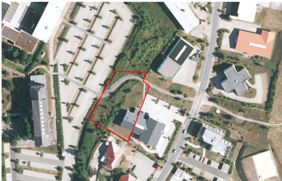
Kartenskizze 2: Maximal für eine Bebauung/Versiegelung in Betracht kommende Fläche

MAXIMALE, FÜR EINE BEBAUUNG / VERSIEGELUNG IN BETRACHT KOMMENDE FLÄCHE