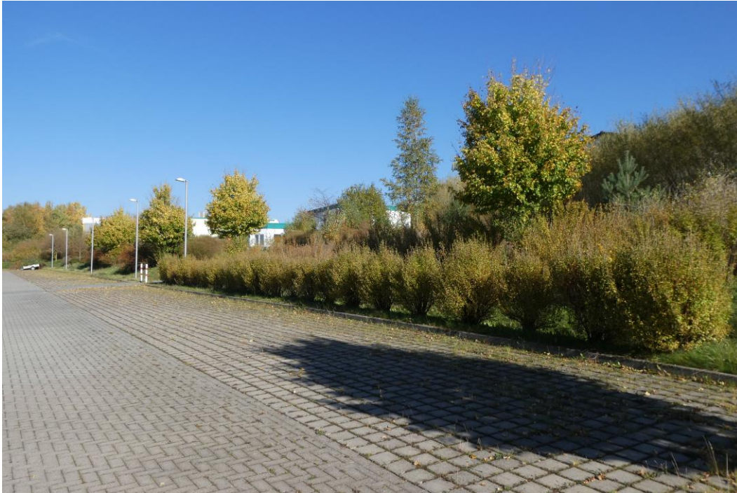
Abb. 1: Blick auf den nordwestlichen Rand des Planungsraumes; im Vordergrund die angrenzenden Parkplatzflächen (17. Oktober 2017)