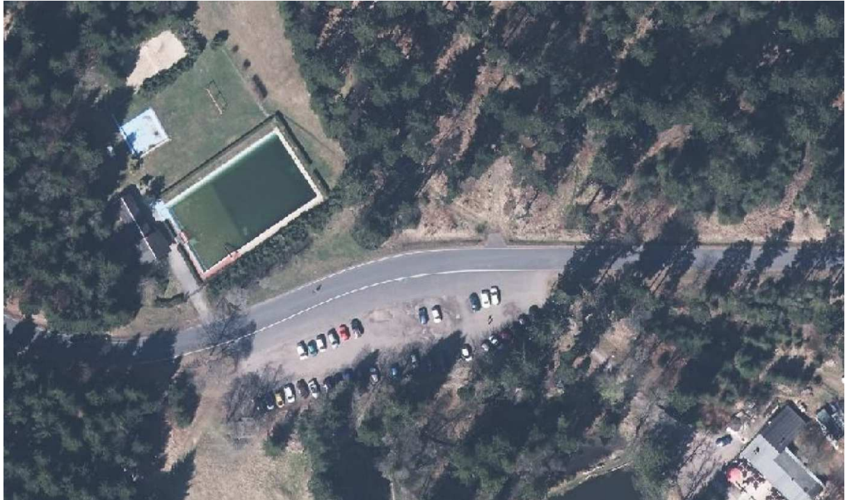
Abb. 1: Luftbild o.M.